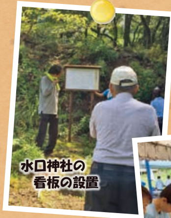
水口神社の 看板の設置

『畑山「山援隊」』では、一緒に活動してくれる仲間を募集しています！興味のある人は、ぜひご連絡ください。