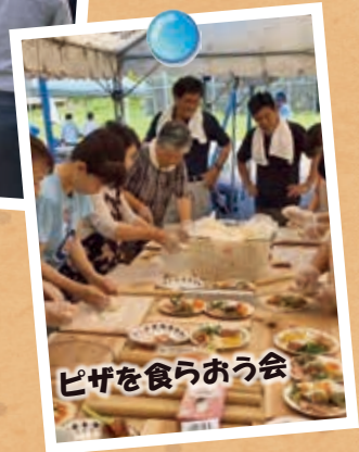
ピザを食らおう会