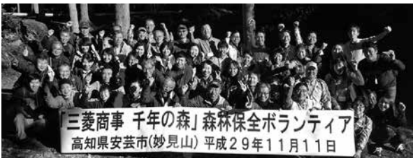
三菱商事 千年の森 森林保全ボランティア 高知県安芸市(妙見山) 平成29年11月11日

翌日は、午前中に岩崎彌太郎ゆかりの地である生家や閑慶院を巡り、三菱グループ源流の地について見識を深めました。午後は、2組に分かれ、1組はシイタケの収穫体験や内原野陶芸館の見学、もう1組はモネの庭を訪れ園内を見学しました。