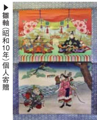
▶ 雛軸(昭和10年)個人寄贈

毎年恒例になりましたおひなさま展が始まります。今年も幕末から昭和初期の古いおひなさま約200体が一堂にそろいます。写真の雛軸は、ひな飾りに使われた掛軸です。かつては、人形と一緒に飾ったり(人形の後ろに掛ける)、人形の代わりに掛けて飾ったようです。紙に印刷されたもので、安価で人形より手に入りやすかったようですが、今に残るものは少なく貴重です。 掛軸の上半分には、おひなさまとお内裏さまが描かれ、下半分には武装した神功皇后と皇子(後の応神天皇)を抱く武内宿禰が描かれています。神功皇后は、夫の仲哀天皇の急死(200年)の後、お