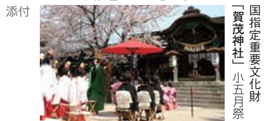
添付 国指定重要文化財 「賀茂神社」小五月祭

件名 「平清盛」ゆかりの地 室津 本文 いよいよNHK大河ドラマ「平清盛」が始まりました。清盛は1180年、高倉上皇と厳島神社を参拝します。それを記録した「高倉院厳島御幸記」では、清盛が賀茂神社(たつの市御津町室津)を参詣し船旅の安全を祈ったことが記されています。多くの歴史上の人物が立ち寄り交通の要衝として栄えた室津へ、ぜひお越しください。