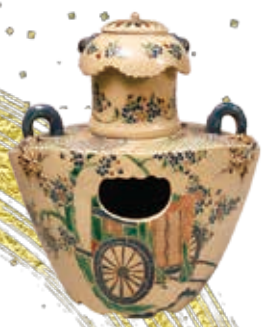
色絵御車図丁字風炉