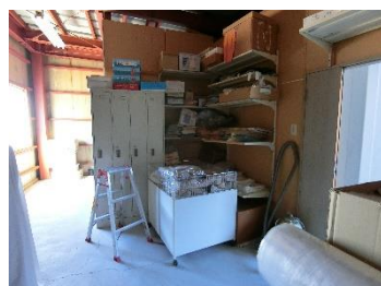
⑤2F 倉庫 A