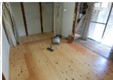
② 1F 洋室