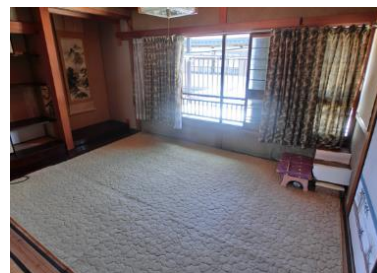
④ 2F 和室 B