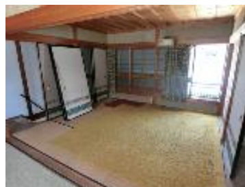
③ 2F 和室 A