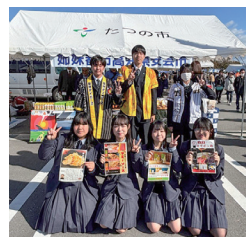
▲(下)安芸高校(上)龍野北高校

安芸高校と龍野北高校の生徒が合同での特産品販売や、楽っ組によるよさこい踊り、祭屋よさこい踊り子隊と赤野獅子舞の共演など、たつの市の皆さんに姉妹都市・安芸市をPRしてきました。