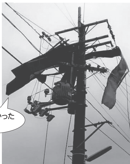
電柱に掛かった トタン

*お電話が繋がりにくいときには、繋がるまでお待ちいただくか、しばらくたってからおかけ直してください。