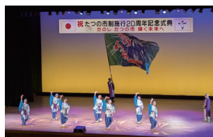
▲たつの市制施行20周年記念式典(市長出席)

また、今年はたつの市制施行20周年、「岩崎家ゆかりの地」と称して広域連携事業を行っている岩手県雫石町も町制施行70周年の節目を迎えられました。安芸市からも式典に参加し、お祝いするとともに、今後さらなる相互交流を深めていきます。