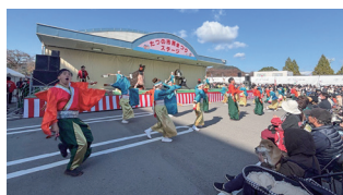
▲祭屋と赤野獅子舞