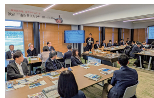
▲グループディスカッションの様子

現在、年間を通じて三菱グループのさまざまな団体が安芸市へ訪問しており、三菱グループと安芸市の絆は、さらに濃く、深くつながりつつあります。