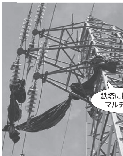
鉄塔に掛かった マルチシート