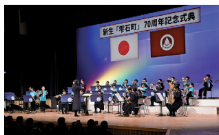
▲新生雫石町70周年記念式典(副市長出席)