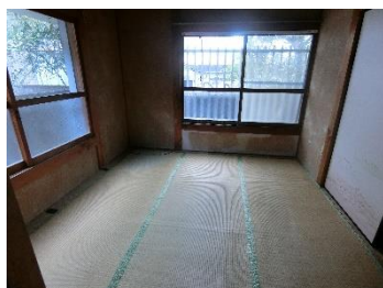
②1F 和室 B