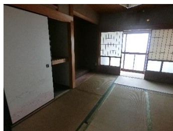
③1F 和室 C