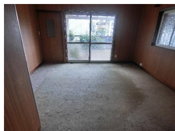
①1F 和室 A