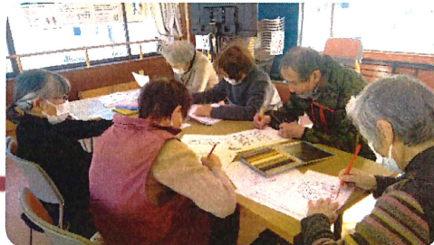
クイズ・ぬりえ・計算「脳トレ」みんなできれば何のその！(^ ^)!