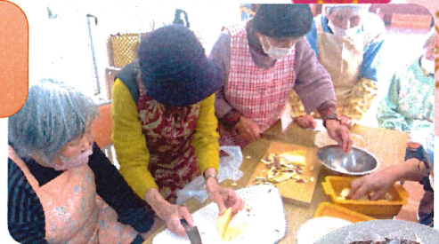
さつまいもを使った チーズケーキ