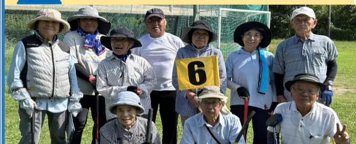
安芸GGクラブの皆さん