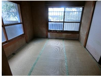
②1F 和室 B