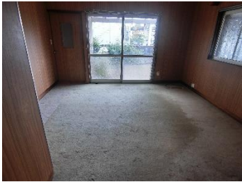
①1F 和室 A