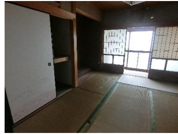
③1F 和室 C