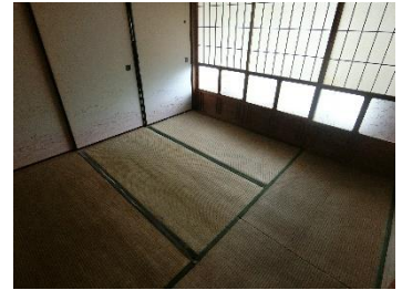
④1F 和室 D