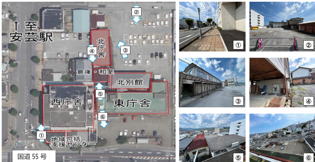
図表 敷地内の様子