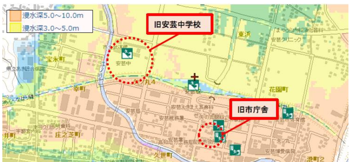
図表 最大クラスの地震（L2）の際の津波浸水予測図

旧市庁舎敷地は、発生頻度の高い地震（L1）による津波で2～3メートル浸水し、最大クラスの地震（L2）による津波で6.5メートル浸水する予測が示されている。また、西庁舎周辺の地盤では、液状化リスクが指摘されている。