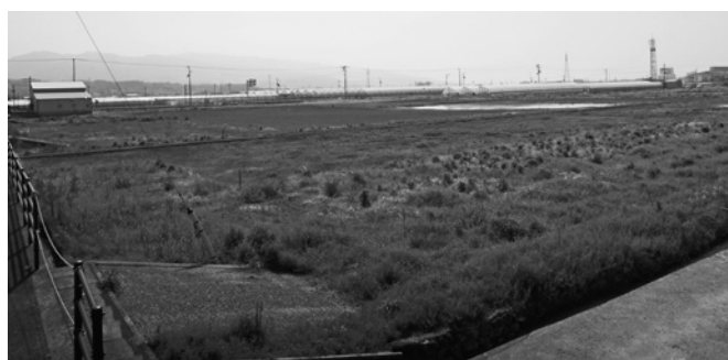
新庁舎建設予定地

市役所新庁舎用地（安芸市土居の県道高台寺川北線と市道中道線、現在整備中の県道安芸中インター線との交差点南西側の土地1万4918・7平米、取得価格は1億5433万840円）を取得するため、議会