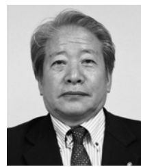
とみ 文 人 まつ 松 人 こ 小 松 人 (こころざし自由の会)