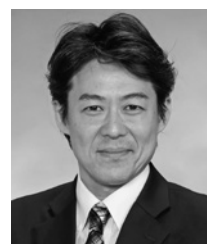
やぶ しんおの たば しんおの ふじ 藤 (共歩会)