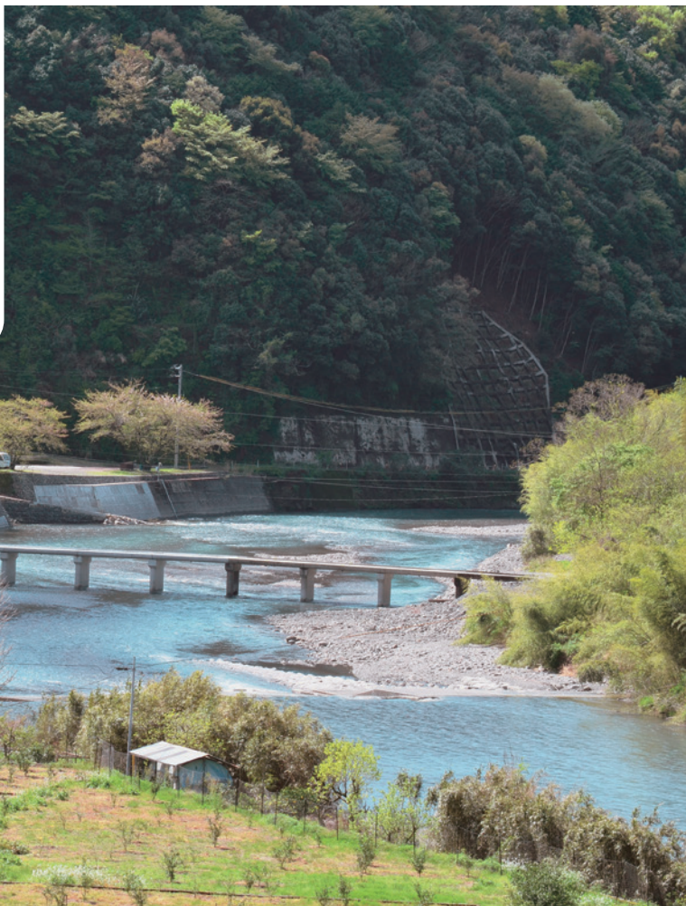
復旧された沈下橋 & 森林鉄道跡（伊尾木・花地区）