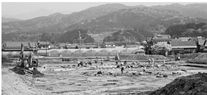
埋蔵文化財発掘調査事業