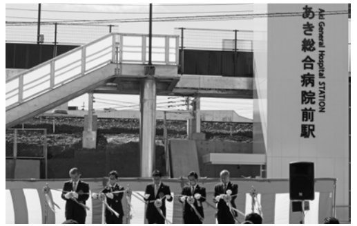
あき総合病院駅が開業（令和3年3月13日）

あき総合病院前駅完成に よる事業費確定に伴い、補 正前の予算12億156・2 万円から6349・3万円 を減額するもの。