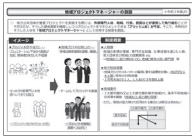
地域プロジェクトマネージャー 令和3年度より 総務省HP

国の地域おこし企業人交流プログラムに手を挙げて、来年度、JAL系列の会社から人材を受け入れ、観光の磨き上げ等の業務に従事してもらう予定である。