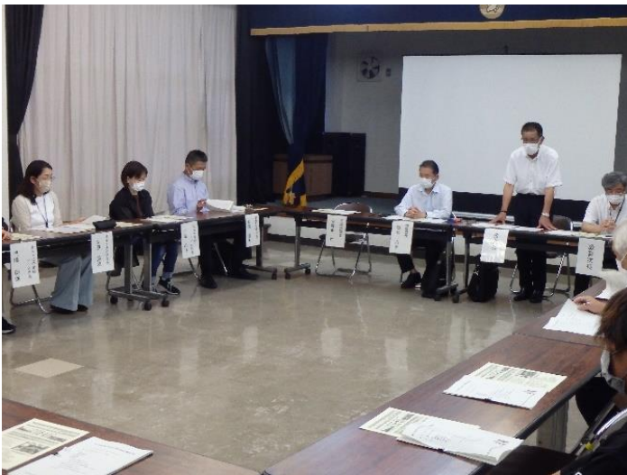
第9回開校準備委員会の様子