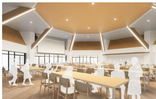
交流により生徒のコミュニケーション力が高まるランチルーム