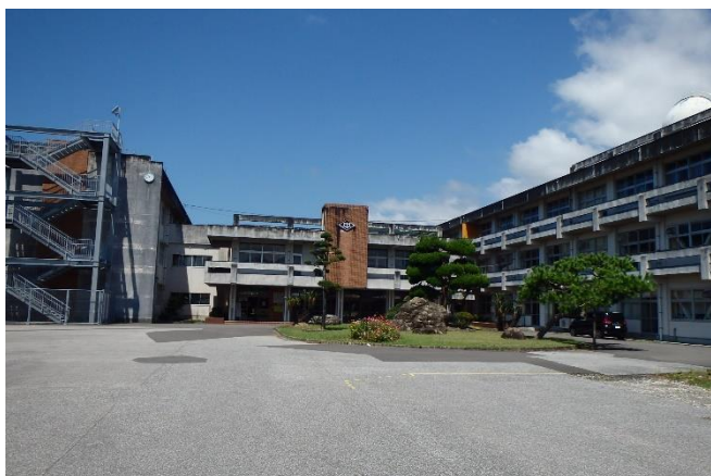
安芸市立安芸中学校（昭和51年～現在地）

安芸市立安芸中学校と清水ケ丘中学校が来年3月末で閉校することから、多くの卒業生に来ていただきたい気持ちでいっぱいです。ぜひ仲間とともに懐かしい学校に訪れ、思い出を呼び起こしてみませんか。