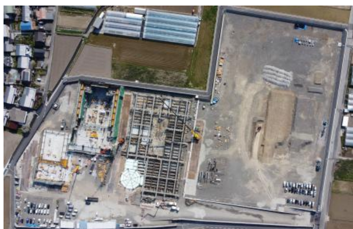
左からプール棟・体育館棟・校舎棟・広大なグラウンド