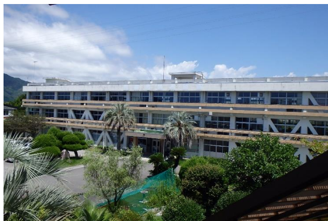
安芸市立清水ケ丘中学校（昭和40年～現在地）