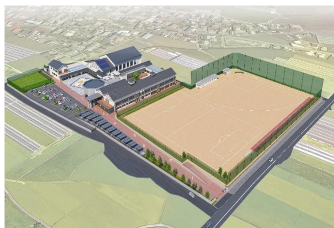
空から見た完成イメージ