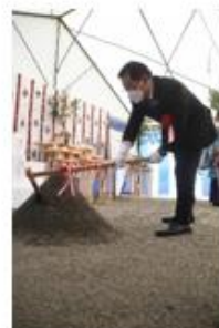
鍬入れを行う市長