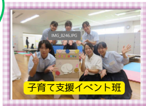
子育て支援イベント班